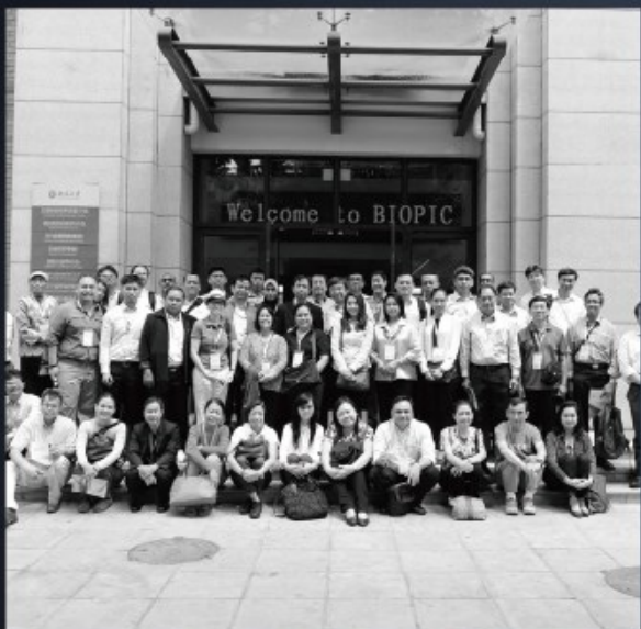
生物动态光学成像中心(BIOPIC)