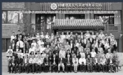
Kavli天文与天体物理 研究所(KIAA-PKU)